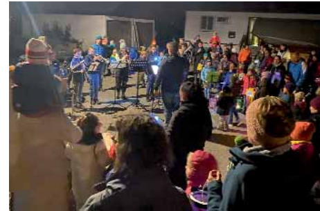
Die JuMu der Blaskapelle Eurasburg spielte beim St.-Martins-Umzug in Achmühle.