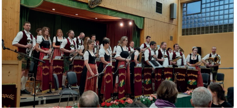
Die Blaskapelle Eurasburg freut sich aufs Osterkonzert. (Foto Konzert '23)

Ein vielfältiges Programm bietet die Blaskapelle Eurasburg beim Osterkonzert, dem Konzerthöhepunkt des Jahres.