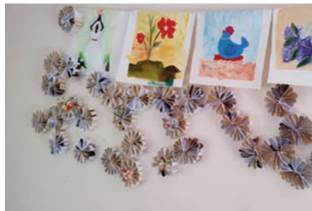
Kunst macht den Alltag und das Leben schöner.

Plätze für Jugendliche im Jugendheim zu organisieren. Bisher waren es 10 feste Plätze. Wir konnten insgesamt auf 20 Plätze erweitern. Es ist nicht immer leicht, die jungen Männer aneinander zu gewöhnen und sie mit den Regeln eines Jugendheims vertraut zu machen. Jeder hat seine eigene Geschichte. Wir versuchen sie mit Schule, Sport, Musik, einer Lehre und mit einer guten Betreuung durch uns, in die Gesellschaft einzugliedern.