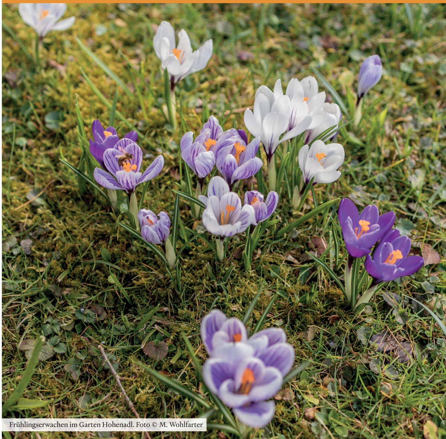
Frühlingserwachen im Garten Hohenadl.

Herausgegeben von der Gemeinde Eurasburg.