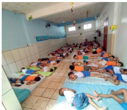
Völlig versunken in den Mittagsschlaf nach dem guten Mittagessen.

Im Jahr 2023 hatten wir mit der finanziellen Beschaffung von Lebensmitteln in den Kindergärten zu kämpfen. Insgesamt haben wir Platz für 420 Kinder, alle Plätze sind belegt. Je Kind erhalten wir pro Tag 1,36 Real (0,26 €). Für diese 1,36 R$ müssen wir vier Mahlzeiten auftragen: Frühstück, Mittagessen, eine Brotzeit und ein kräftigendes Abendessen. Zum Vergleich: Ein Liter Milch kostet 4,00 Real! Gott sei Dank schaffen wir es immer wieder, alle Kinder trotz der schwierigen finanziellen Situation satt zu bekommen.