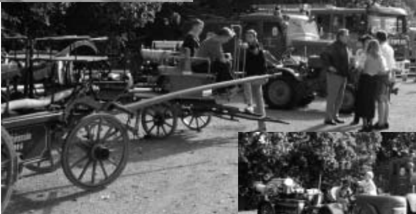
Jung auf Alt