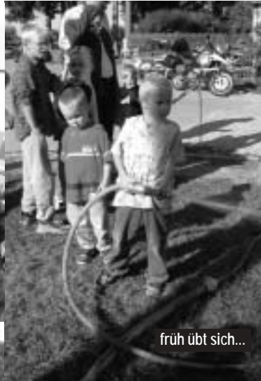
früh übt sich...