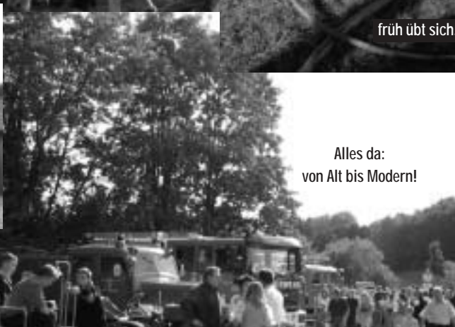
Alles da: von Alt bis Modern!