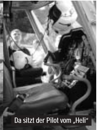
Da sitzt der Pilot vom „Heli“