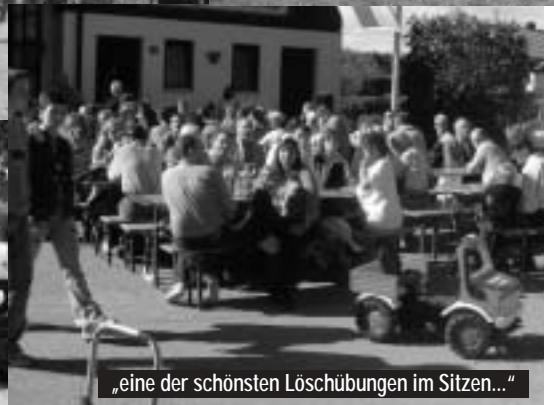
„eine der schönsten Löschübungen im Sitzen...“

Es war ein höchst gelungener Tag und vom Wetter her ein Volltreffer!