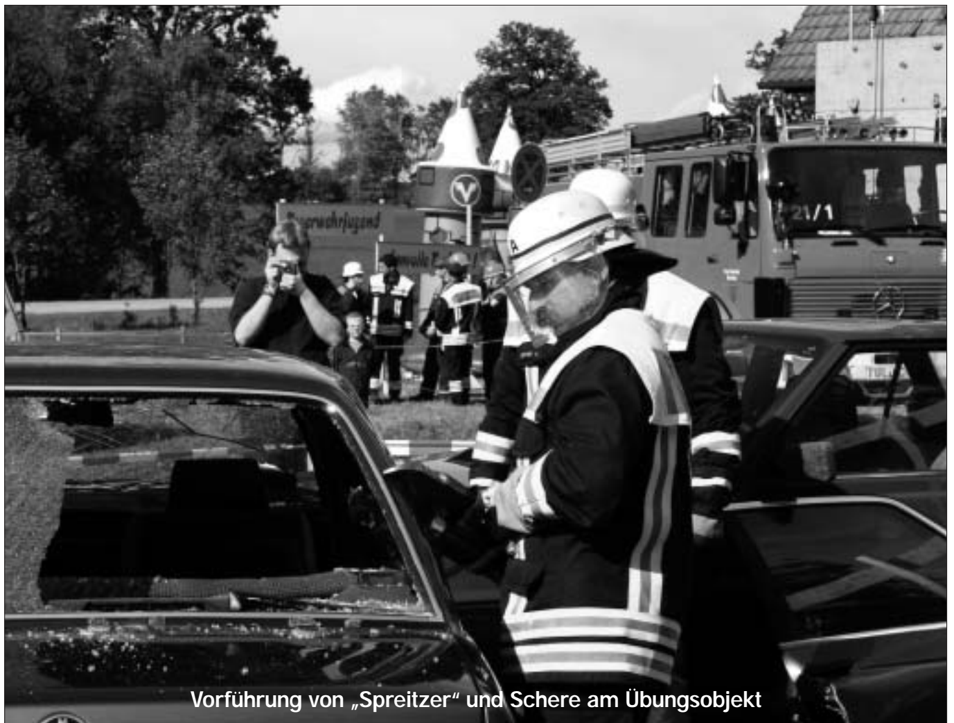
Vorführung von „Spreitzer“ und Schere am Übungsobjekt