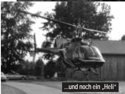
...und noch ein „Heli“