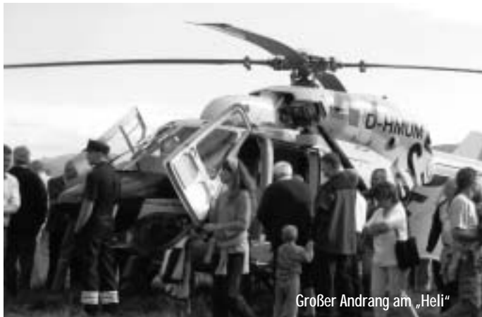
Großer Andrang am „Heli“