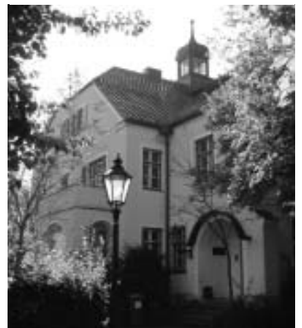
Littig-Villa in Wolfratshausen

schen Abteilungen der Inselhaus- Kinder- und Jugendhilfe gGmbH. Sie hat seit 2004 ihren Hauptsitz in der Littig-Villa in Wolfratshausen hat. Von ihr werden 80 Kinder und Jugendliche vom Säuglingsalter bis zur Volljährigkeit teilstationär und stationär betreut.