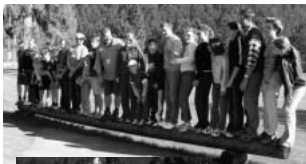
Grenzerfahrungen haben die Skifahrer des SV Eurasburg am 17.09.2004 beim Teamtraining im „Hochseilpark Werdenfels“ gesammelt.

Die wirksamste und umweltfreundlichste Methode ist nach wie vor, das herab gefallene Laub schnellstens abzutransportieren oder es vor Ort mit Sand oder Gras abzudecken. So verhindert man, dass sich die Motteneier zu Larven weiterentwickeln. Der Erfolg der letzten Aktion war heuer deutlich festzustellen!