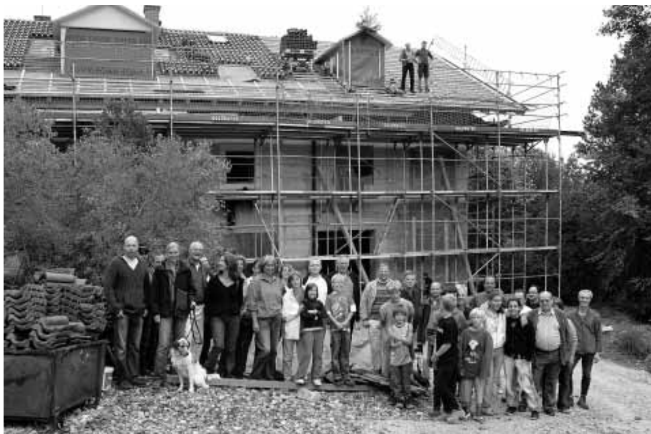
Die Erweiterung und Renovierung des über 100 Jahre alten Kinderheims in Eurasburg hat Fortschritte gemacht. Dies feierten die Kinder und Jugendlichen der Inselhaus Kinder- und Jugendhilfe mit den Handwerkern und den Mitarbeitenden beim Richtfest am Freitag, dem 15. September 2006. Die Kinder und Jugendlichen können das Ende der Baustelle kaum erwarten und freuen sich auf helle Räume und viel Platz.

Alle Bewohner der Gemeinde Eurasburg sind herzlich eingeladen.