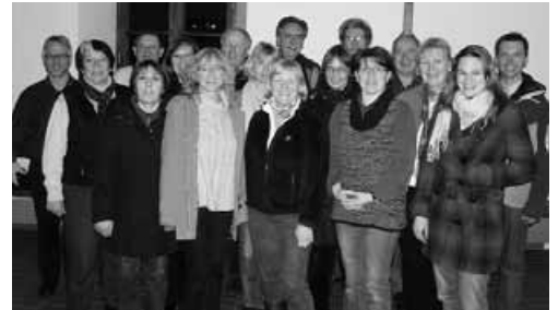
In unserem Chor sind jetzt welche drin, die hier auf dem Bild noch nicht drauf sind (und umgekehrt).

Th. Dubois! Eine gute Gelegenheit, etwas Gutes für Seele und Gemüt zu tun.