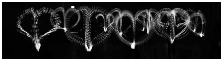
Mit Leuchtstäben malen sie Herzen in die Luft (die Mädels) und dazu gibt es heiße Rhythmen.

Wer Lust hat auf lateinamerikanische Musik mit viel Bewegung der ist herzlich eingeladen in der Eurasburger Sporthalle vorbeizuschauen. Zumba gibt es dienstags um 17.30 Uhr und mittwochs um 20.30 Uhr. Für Mitglieder des Sportverein Eurasburg-Beuerberg ist die Teilnahme kostenlose für Nichtmitglieder kostet die Zehnerkarte 50,00 €